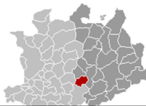
Herenthout in de provincie Antwerpen